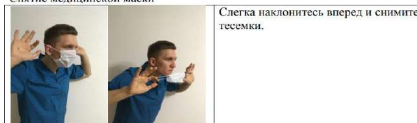
Снятие медицинской маски