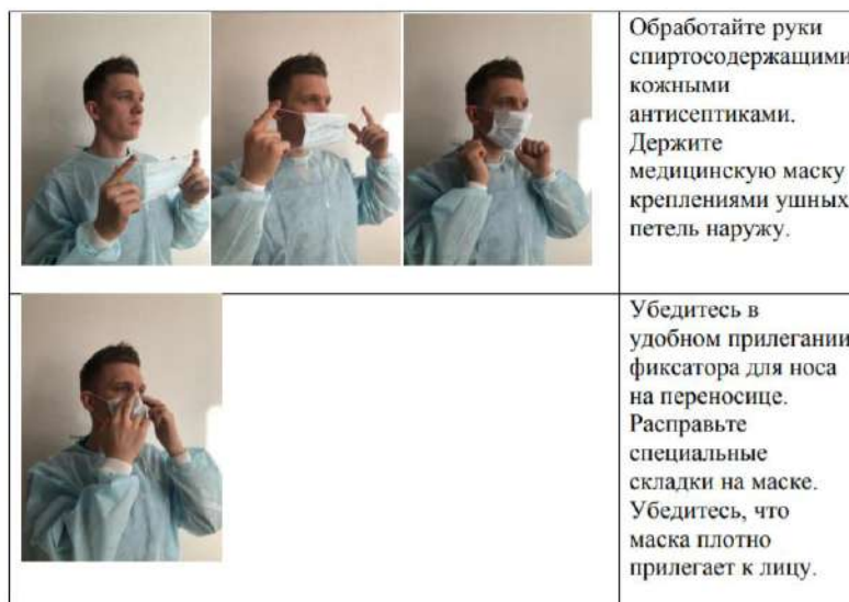
Надевание медицинской маски